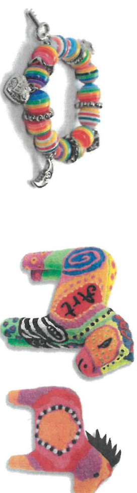
Photos d'objets en carton peints manuellement, créés

Vacances de Juillet 2022 Du 08.07 au 29.07.22